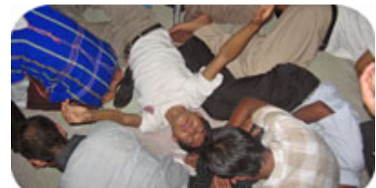
Många utav konferens deltagarna blev döpta i den helige Ande och gjorde starka upplevelser. Flera deltagare, som tidigare varit starka buddister, blev även befriade ifrån onda andar.