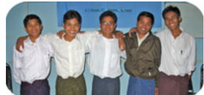
I februari månad kommer vi att sända ut detta 5-man starka team till Magwe City i Myanmar, där dom ska plantera en stark församling.