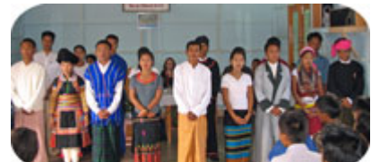
En bra bit över 100 människor, ifrån 17st olika etniska folkgrupper, samlades under missions konferensen, för att utrustas till att ta evangelium till sina respektive folk.

För cirka ett år sedan började en kärlek växa fram i våra hjärtan till Myanmars folk, och den kärleken har bara fortsatt att växa sedan dess. I takt med att kärleken till landet har växt, har Gud också öppnat fler dörrar för oss att på ett konkret sätt kunna vara med och bygga Guds rike bland dom onådade folken som bor där. Bland annat så har vi tillsammans med vår lokala samarbetspartner satt samman ett församlingsplanterings team, som vi kommer att sända ut i början utav år 2008 till en nyckelstad i en väldigt onådd region, där dom ska plantera en stark moderförsamling. Gud har också