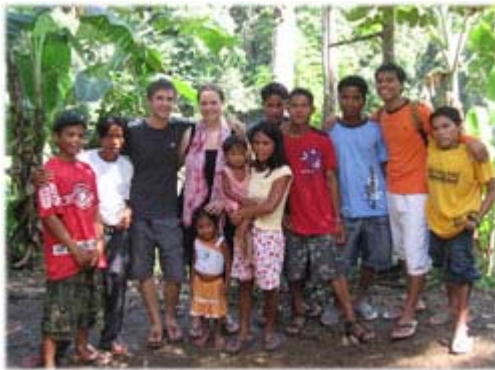
Tillsammans med medarbetare i Patil med omnejd.

Samtidigt som vi firar alla dom segrar vi hitintills fått se bland animist folken på centrala Mindanao, inser vi att vi bara är i början av allt det Gud vill göra bland dessa folken. Det finns fortfarande så många byar belägna långt in i Mindanaos djungel, där människor som aldrig har hört namnet Jesus lever. Folken på dessa platser lever sina liv i skräck för onda andar som dom måste blidka genom olika typer av offer. Församlingen i Patil fungerar idag som en effektiv bas för att sprida evangelium in till dessa platser, och vi har idag som målsättning att inom kort öka antalet arbetare i vårt team av inhemska missionärer som jobbar utifrån församlingen i Patil, allt för att kunna nå till dem som ännu inte har hört evangelium!