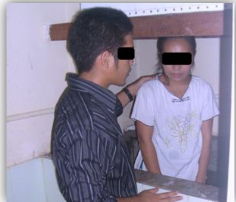
Dop i Yangon

PS. Var gärna med och be extra mycket för alla våra medarbetare i Burma och deras församlingar. I flera av de städer där vi har missionärer får de som tar emot Jesus utstå mycket förföljelse. DS.